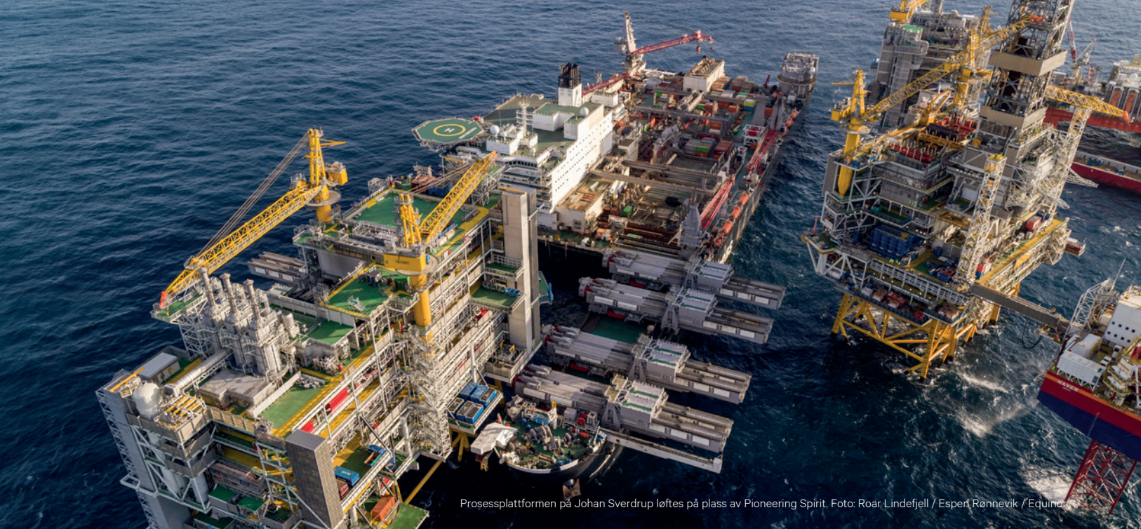
Prosessplattformen på Johan Sverdrup løftes på plass av Pioneering Spirit.